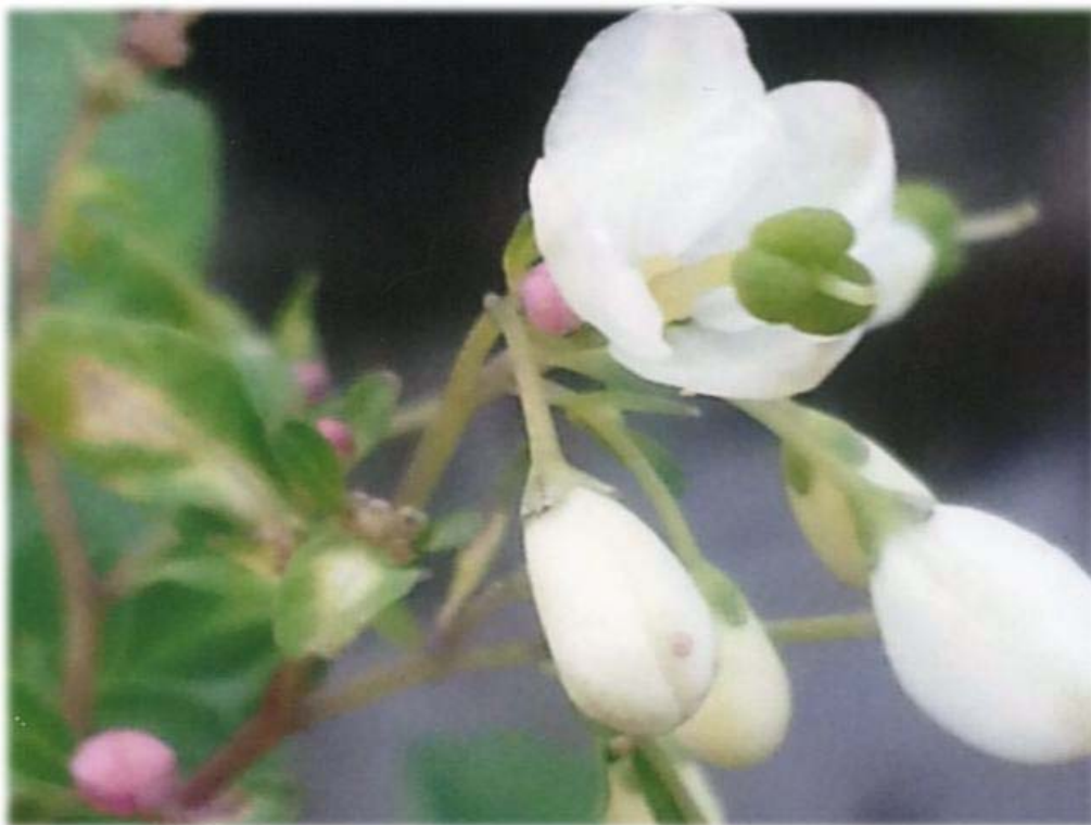
【誌面ギャラリー】松風草（マツカゼソウ） / 風に揺られてやさしい姿に魅了