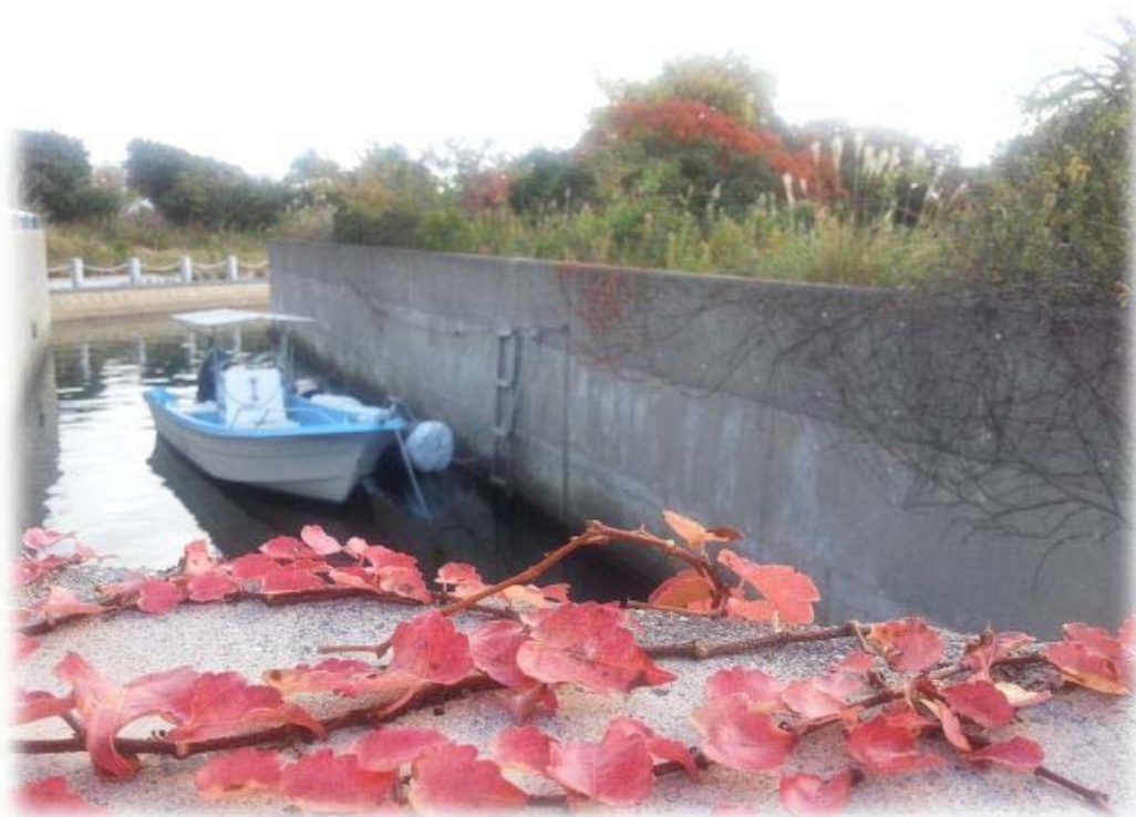
【誌面ギャラリー】秋の訪れを追うようにして鳶の葉も赤く色づく（一級河川撫養川に接する水路）