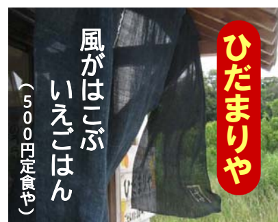
▲軒下に素朴な藍染めのれん、屋号と雲のデザインが店の信用や格感を意味しているような、漂々しく見守っているようだ。