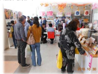
ガス機器コーナー