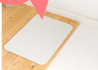
サイズ: 42.5×57.5×H0.95cm 重さ: 約1.8kg カラー: ホワイト

足裏の水分をすばやく吸い取り、時間が経つと自然に乾燥します。丈夫で薄くて軽い、ソイルの浴室足ふきマットです。