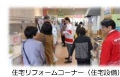
住宅リフォームコーナー (住宅設備)

10月29日・30日の2日間で約1000軒のお客様にご来 場いただきました。昨年よりも会場内のスペースを確保し展 示内容を充実させました。一年に一度しかないイベントも楽 しんでいただけただけです。たくさんのお客様にご来場いた だいたことで大盛況となりました。 皆様には社員一同、心より感謝申し上げます。