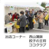
出店コーナー 西山蒲鉾 餃子の王将 ココクラブ