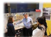
キッチンコーナー