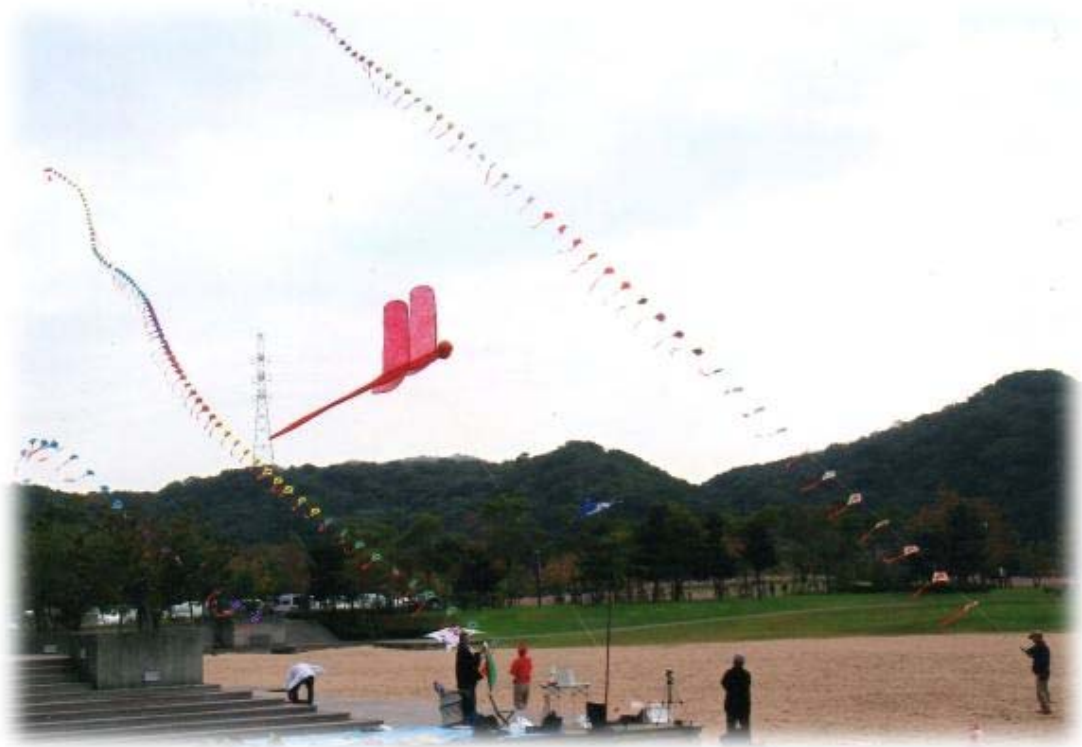
【誌面ギャラリー】－ 全国凧揚げ大会 － (鳴門ウチノ海総合公園)