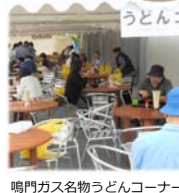
鳴門ガス名物うどんコーナー