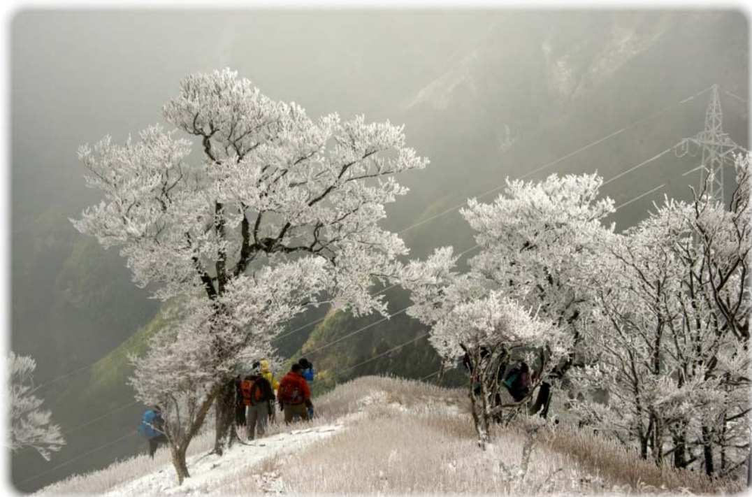
【誌面ギャラリー】氷点下4℃、霧氷とピーンと伸びている送電線ツリー（徳島ファガスの森、高城山）