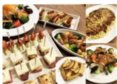
飲み放題付き料理 5,000円 (税別)