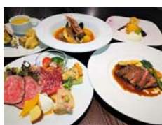
フルコース料理 7,000円 (税別)

『エトワ』さんは親しみやすく気軽に楽しんでいただけるダイニングバーです。お食事会や宴会など、いろんな要望にこたえてくれること間違いありません。