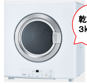
スタンダードタイプ

シンプル機能と使い勝手で選ぶならスタンダードタイプがオススメです。 洗濯物が少ない方や多い方でも選んでいただきやすい乾太くんです。