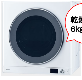
デラックスタイプ

シンプル機能と使い勝手で選ぶならスタンダードタイプがオススメです。 洗濯物が少ない方や多い方でも選んでいただきやすい乾太くんです。