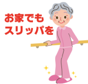
お家でもスリッパを