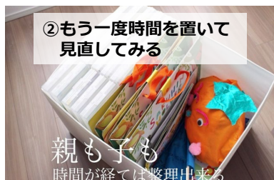
②もう一度時間を置いて見直してみる

クリアケース・クリアファイル等を購入して持って帰ってきた作品を子どもとまとめていきます。立体の作品などは、写真に撮って残すのも良いですよ！