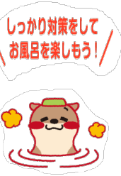
しっかり対策をして お風呂を楽しもう！

寒い日の入浴は、正しい入浴法でお風呂を楽しみましょう。また入浴時だけでなく脱衣所やトイレ浴室など、さらにゴミ出しで外に行くときなど、あらゆる場所での冷えも気になります。トイレなどちよつとした時にも、ヒートショックの可能性があるので、一枚羽織ったりスリッパを履くなど、気軽にできることから始めましょう。