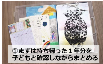
①まずは持ち帰った1年分を子どもと確認しながらまとめる

学年末になると、子どもが作品をまとめて持って帰ってきますよね。今回は作品の整理収納術をご紹介します。